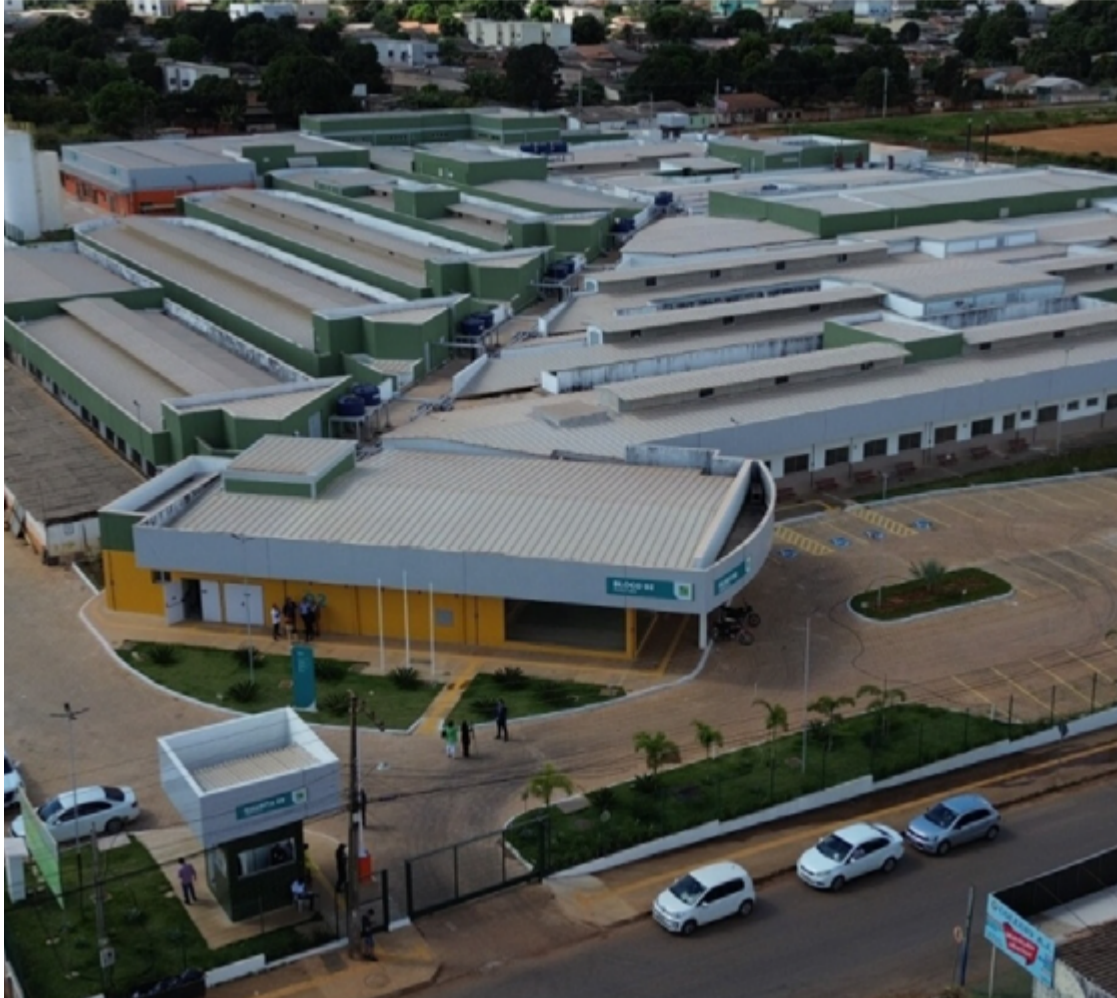
Governo assumiu as obras em 2021 com nova orientação do governador Caiado: realmente finalizar o hospital