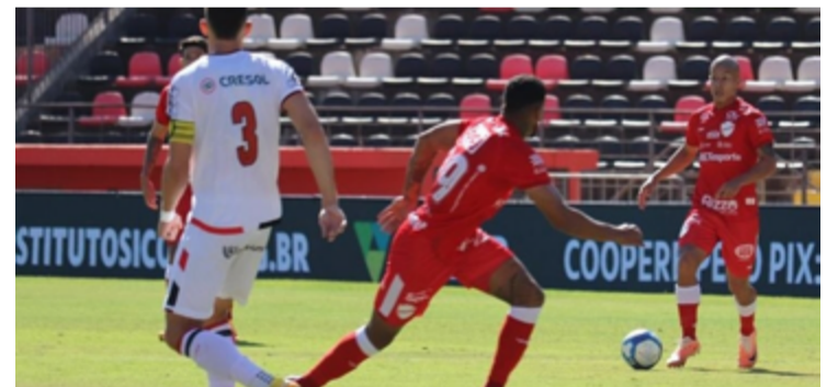
Vila Nova nadou, mas morreu na praia em jogo pela série B: Pantera fez e segurou placar

Tigrão perdeu ontem para Botafogo de São Paulo em disputa da série B. Colorado segue distante do grupo de acesso