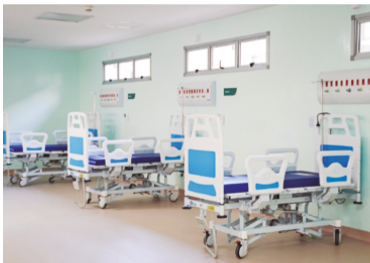
HEAL possui 164 leitos, incluindo maternidade e 40 leitos UTI

Com quase o dobro do tamanho originalmente planejado, o hospital tem 16 mil metros quadrados de área construída, com 18 blocos, 164 leitos, incluindo uma maternidade e 40 leitos de unidade de terapia intensiva (UTI). Também vai oferecer exames de tomografia, ressonância magnética, raio-X, ultrassom e bancos de sangue e leite. Todos os serviços serão gratuitos por meio do Sistema Único de Saúde (SUS). O Governo de Goiás investiu mais de R$ 157 milhões, sendo R$ 110,1 milhões para construção e R$ 47,7 milhões para aquisição de equipamentos e de mobiliário.