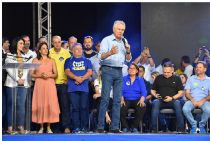
Ronaldo Caiado e lideranças nacionais do União Brasil: novo projeto de gestão para o país

A multidão composta por caravanas de Goiás e do país gritava “Caiado, presidente!”. Muitos criaram camisetas artesanais com a imagem de Caiado e mensagens de que o Brasil precisa dar um basta ao crime organizado e melhorar a Segurança Pública – uma das bandeiras de Ronaldo. “Muito obrigado ao União Brasil por discutir os rumos do país e confiar a Goiás o