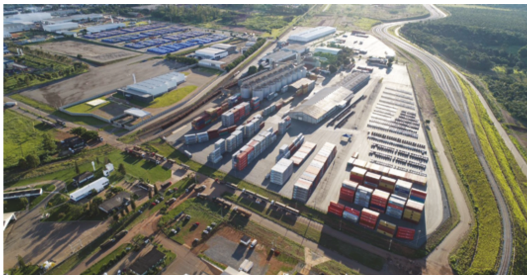
Indústria Zhonghong, quer distribuir produtos em Anápolis, utilizando Porto Seco como base logística

Outra conquista relevante foi a criação de uma unidade laboratorial de medicamentos da medicina tradicional chi-