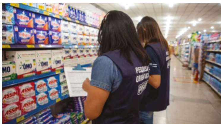
O pote de margarina de 500g teve a maior variação de preço, com 130%

Levantamento do Procon indica que alta foi puxada por produtos como farinha de trigo, margarida, carne de segunda e arroz