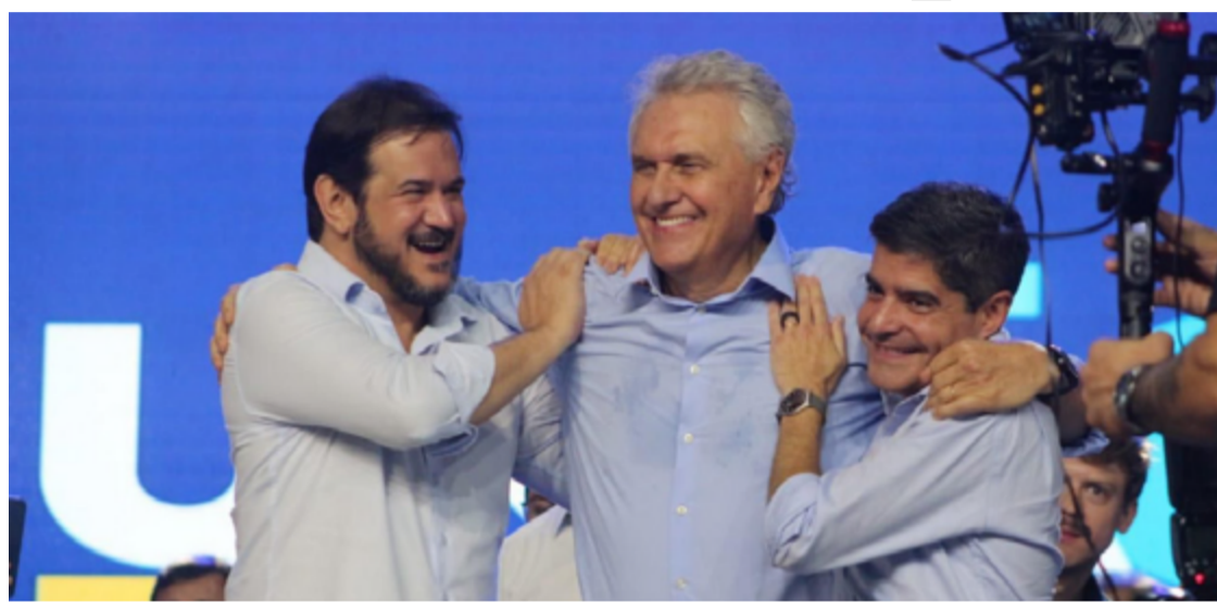
Antonio Rueda, Ronaldo Caiado e ACM Neto: União Brasil unido para lançar nome ao Planalto

Senador do Paraná, Sérgio Moro lembrou das perseguições que tem sofrido e alertou o partido: a disputa de 26 não será fácil, mas o UB tem nomes