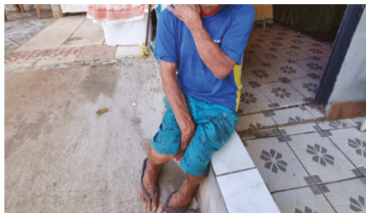
Idosos são agredidos e obrigados a sobreviver em situações degradantes

E aí o delegado observa outra situação gravíssima: quando o agressor é multado, ele ameaça o próprio idoso para que lhe dê dinheiro – o dinheiro da aposentadoria – para poder pagar o que deve à Justiça. “Olha a insensibilidade do legislador”, ressalta o delegado, criticando senadores e deputados federais responsáveis por leis desse tipo no país. Há casos também das vítimas que recorrem a empréstimos para tirar ajudar o filho o neto que o agrediu e que foi condenado.