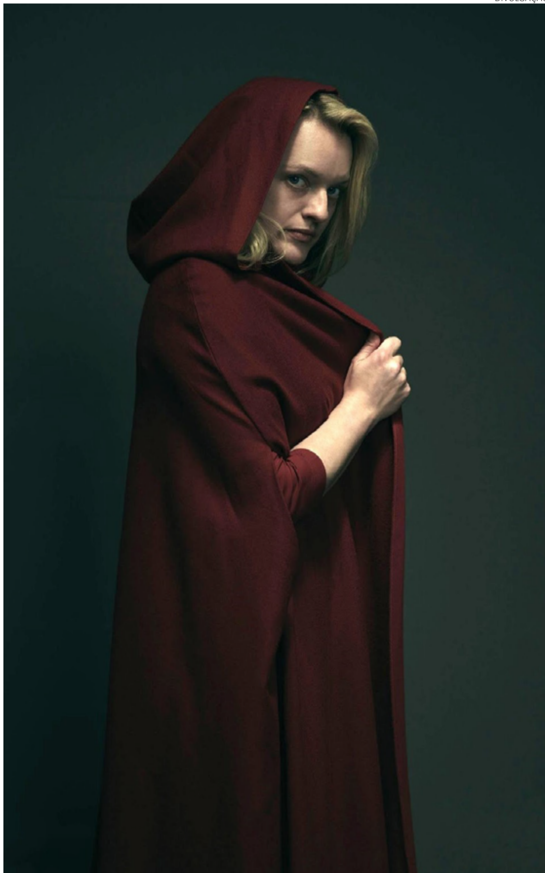
Elisabeth Moss interpreta June Osborne em 'O Conto da Aia'

Caso o projeto seja aprovado nas duas do Congresso e sancionado pelo presidente, a mu-