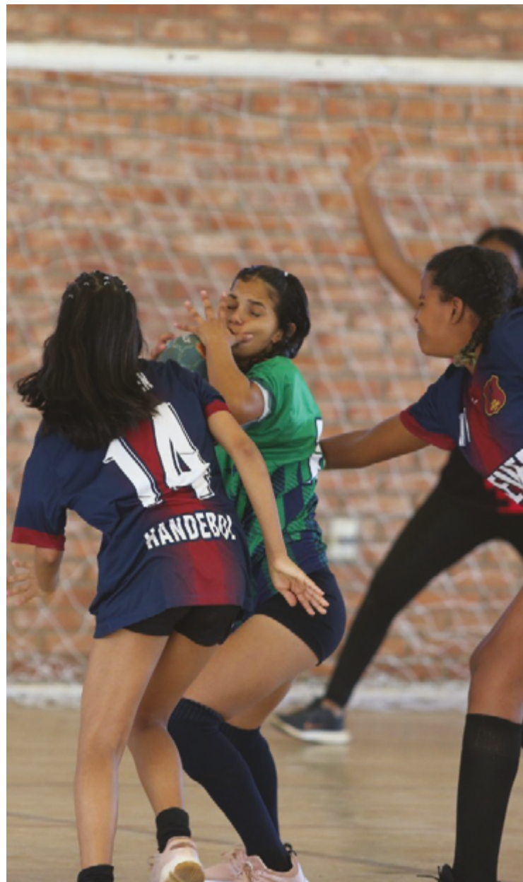
Modalidades coletivas têm basquete, futsal, voleibol, vôlei de praia e handebol