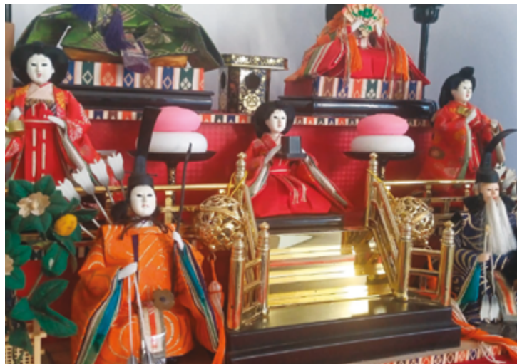
Mostra prepara o Centenário da Imigração Japonesa em Anápolis